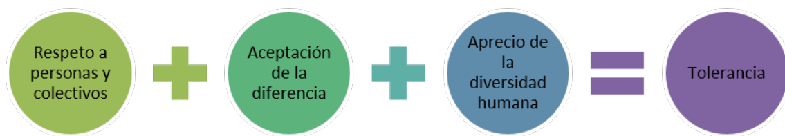
Ilustración 1 Significado de Tolerancia

El siguiente gráfico resume y representa de forma clara y precisa el concepto de tolerancia: