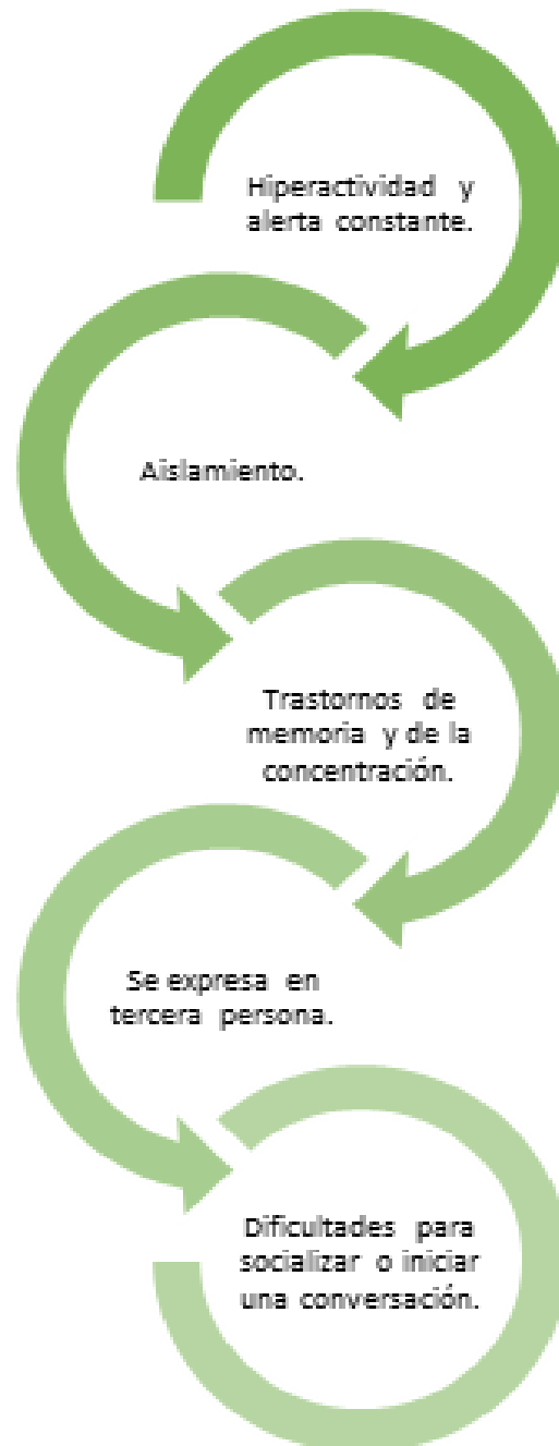
Ilustración 2 Dimensiones psicossociales

Lo anterior, debilita la construcción de identidad individual y colectiva, generando un desarraigo cultural que debilita el tejido comunitario, los procesos integración y capacidad para adaptarse a la cotidianidad de la vida civil o de la vida en la ciudad.