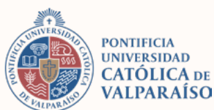
Pontificia Universidad Católica de Valparaíso (PUCV) | Chile