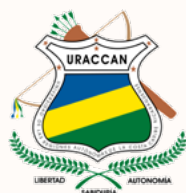
Universidad de las Regiones Autónomas de la Costa Caribe Nicaragüense (URACCAN) | Nicaragua