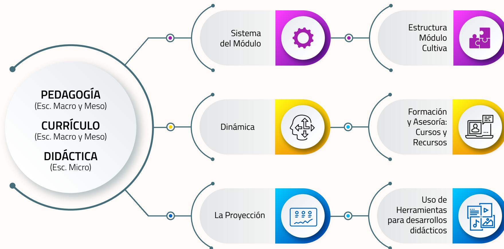
Ilustración 1. EL MÓDULO CULTIVA: UNA ALTERNATIVA PARA LA EDUCACIÓN ACCESIBLE Y AFECTIVA EN LAS IES