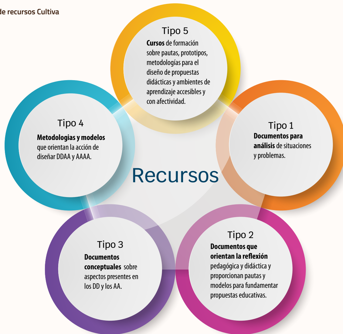
Ilustración 3. Sistema de recursos Cultiva

de diseños didácticos y de ambientes de aprendizaje accesibles y con afectividad; la formación de profesores universitarios en temas de didácticas accesibles e incorporación de afectividad en los ambientes de aprendizaje. A continuación, se presentan los recursos: