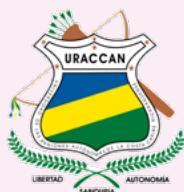
Universidad de las Regiones Autónomas de la Costa Caribe Nicaragüense (URACCAN) | Nicaragua