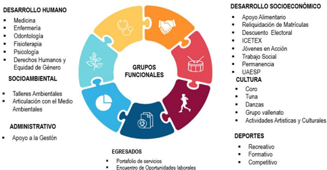
Grupos Funcionales del Centro de Bienestar Institucional y sus servicios