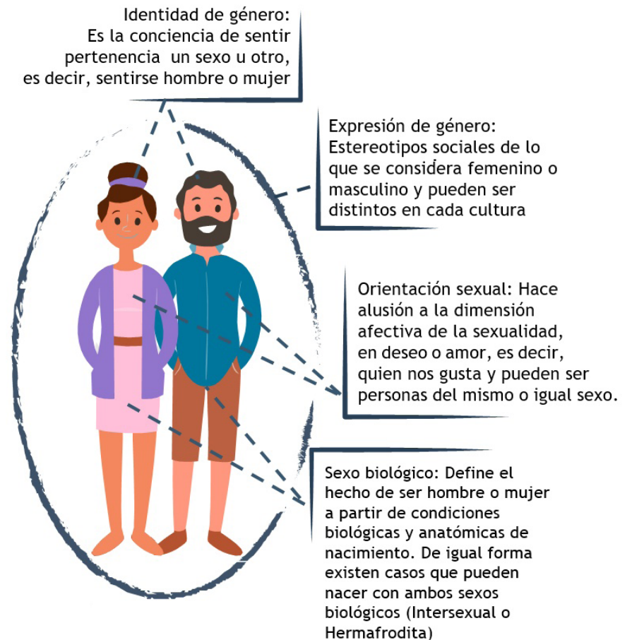
Figura 1. Dimensiones de la sexualidad (Steilas, 2015)

Las dimensiones de la sexualidad expresan las diversas formas de vivirla y sentirla. La forma en que esto ocurre permite conocer a los seres humanos como hombres o mujeres, quienes pueden ser heterosexuales, homosexuales, bisexuales, transexuales o asexuales.